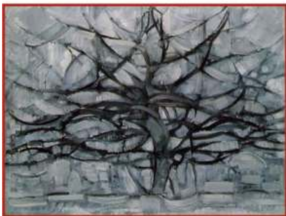
Piet Mondrian "Grey-tree" 1911