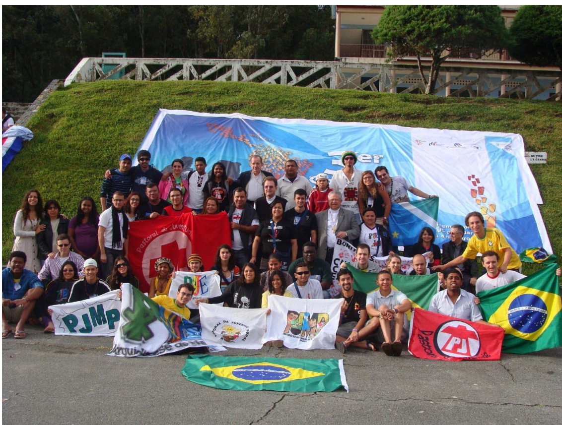
Foto oficial da delegação brasileira

Brasileira de Centros e Institutos de Juventude reuniu centenas de materiais, textos, histórias e subsídios, tendo tido mais de 15 mil acessos por mais de 50 países de todo o mundo.